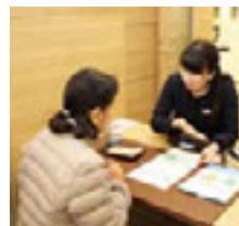
▲富士鷹岡支店店内