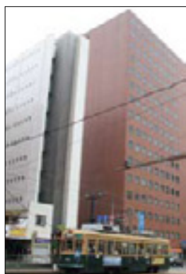
▲広島支店が入居する広島三井ビルディング外観

今後も、豊富なリテール商品のご提供を通じ、お一人おひとりの夢の実現をお手伝いしてまいります。