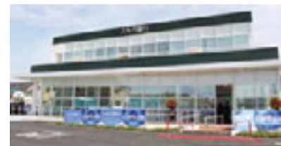
▲茅ヶ崎鶴が台支店外観