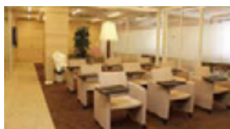
▲支店内 ▼ドリームプラザ広島入口