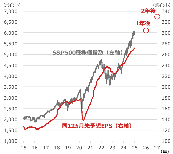
S&P500種株価指数と 同12ヵ月先予想EPS（1株当たり利益）

期間：2015年1月2日～2025年1月3日、週次 ●印は1年後、2年後の12ヵ月先予想EPS（2025年1月3日時点のBloomberg予想）